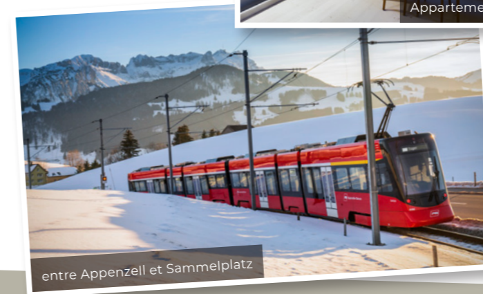
entre Appenzell et Sammelplatz